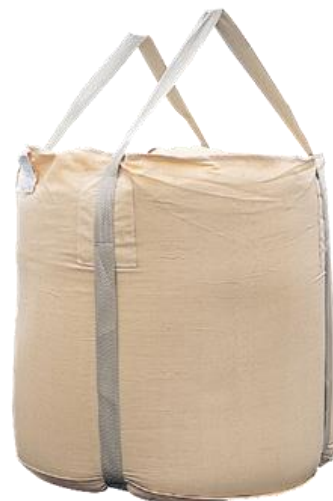
ワンウェイタイプ