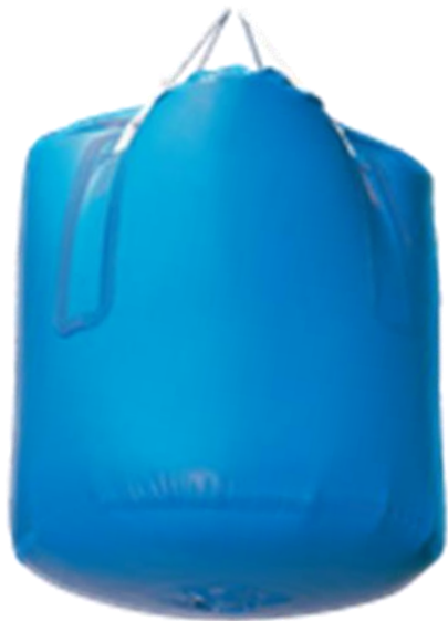
ランニングタイプ